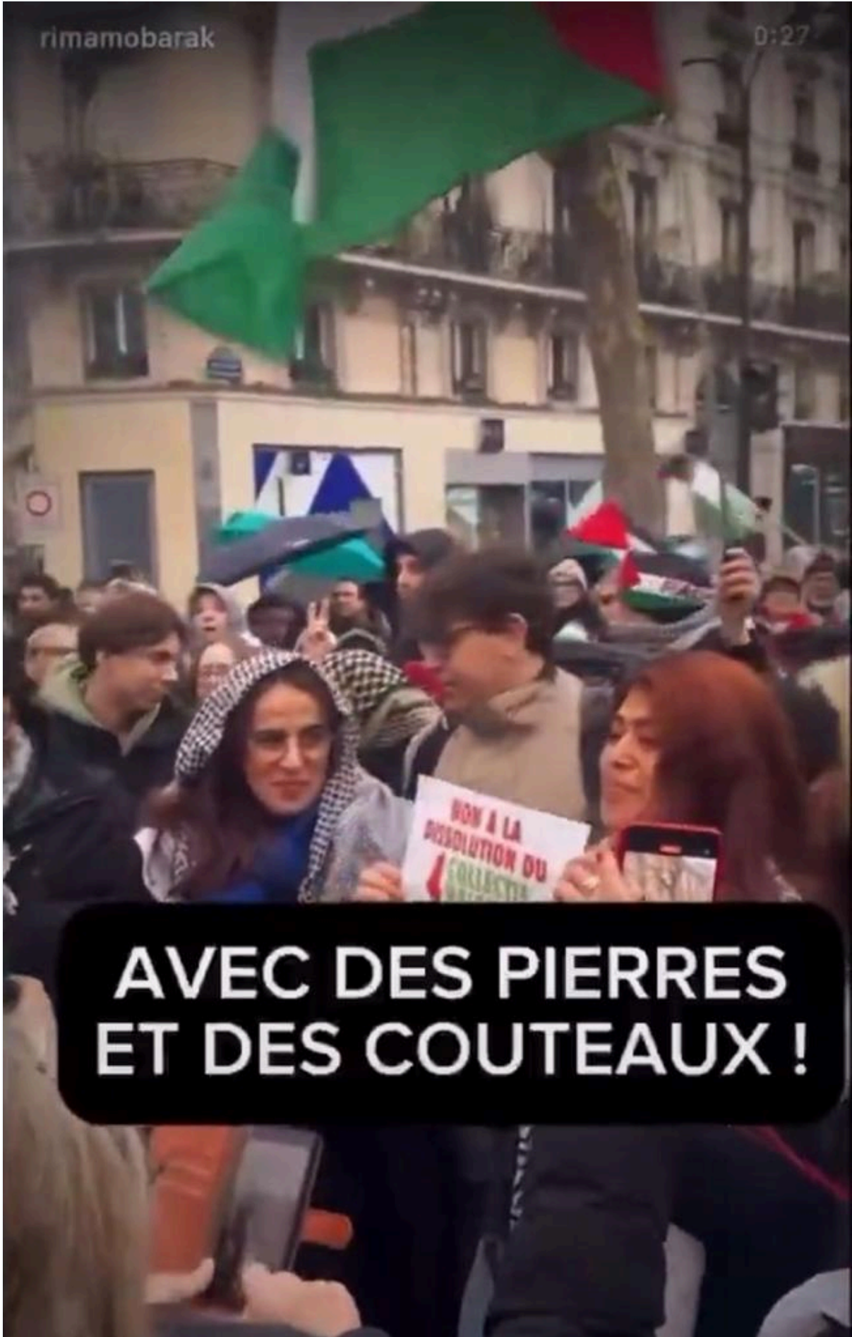
Capture de format court publié en janvier 2025. La traduction a été ajoutée en superposition.

Une logique de diffusion et de durcissement du registre