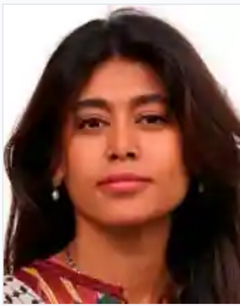
Rima Hassan EURODÉPUTÉE AU PARLEMENT EUROPÉEN