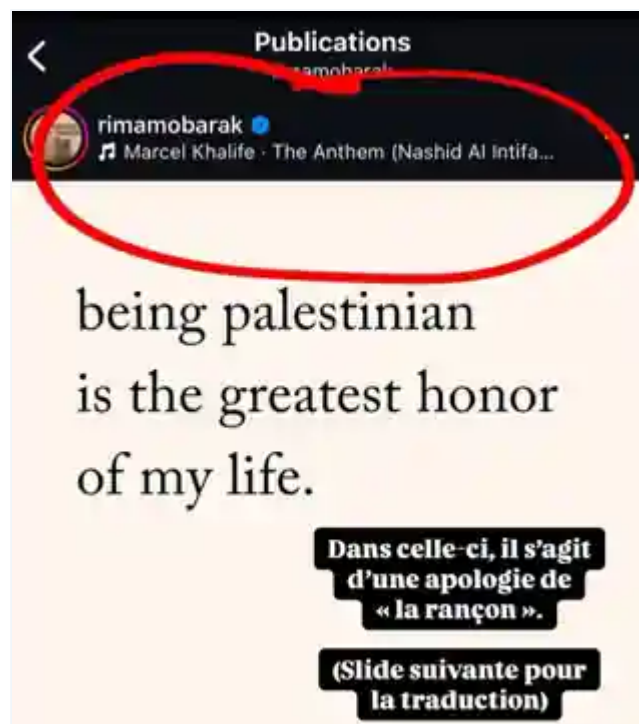
Capture illustrant l'usage d'une piste audio en arabe.

La capture fait apparaître le compte officiel de Rima Hassan intitulé « rimamobarak » et la piste musicale « Marcel Khalife · The Anthem (Nashid Al Intifa...) ».