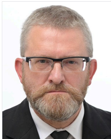
Grzegorz Braun EURODÉPUTÉ POLONAIS CITÉ COMME PRÉCÉDENT INSTITUTIONNEL

Grzegorz Braun est un eurodéputé polonais ayant fait l'objet d'une levée d'immunité parlementaire, c'est-à-dire de la protection attachée aux élus dans l'exercice de leurs fonctions, en mars 2026. La raison retenue par le Parlement européen est essentielle à comprendre : les faits visés relevaient de propos publics et de faits de droit commun jugés étrangers à l'exercice normal de son mandat, donc détachables de son activité parlementaire.